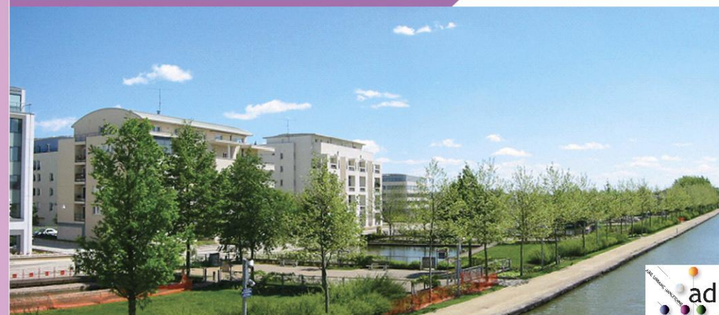
Nancy : le nouveau quartier Rives de Meurthe autour des Jardins d'Eau