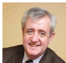
Charles-Éric Lemaigen Président de l'AdCF Assemblée des Communautés de France