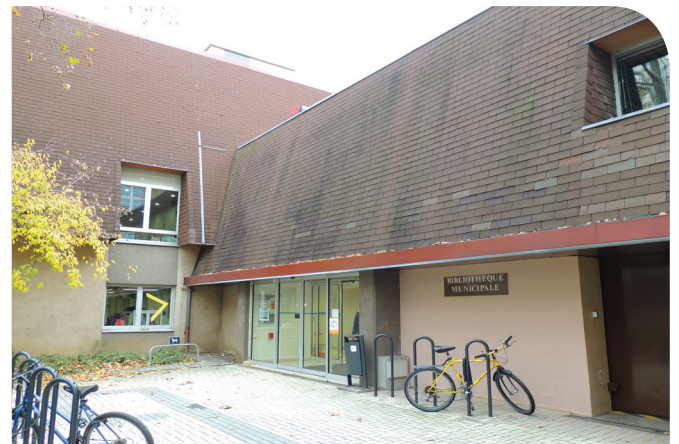
Les bibliothèques, un levier d'éducation de proximité à fort potentiel d'amélioration. Ici, la bibliothèque Grand'Rue

Mulhouse a lancé en 2014 un plan école pour réhabiliter, étendre ou construire les bâtiments d'enseignement. La ville a réussi à initier un parcours scolaire international capable d'attirer d'autres familles dans l'agglomération frontalière. Malheureusement, les collectivités ont peu de marge de manœuvre pour renforcer l'encadrement scolaire , levier majeur d'amélioration de la qualité de l'offre éducative.