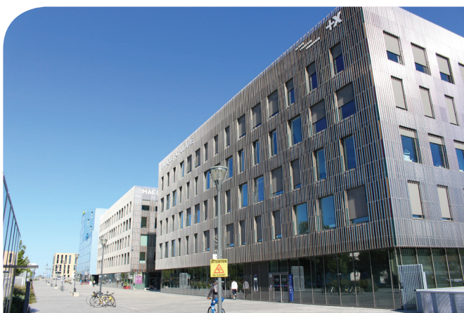
Le pôle gare combine accessibilité et ambition urbanistique

Le grand succès des vélos en libre-service a transformé l'usage des espaces publics. Les aménagements cyclables sont doucement mis en oeuvre.