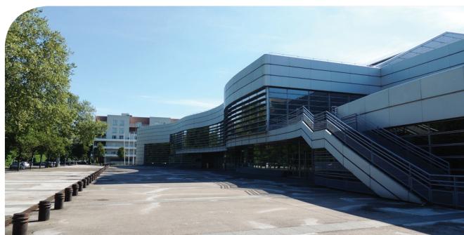
Quelle intégration urbaine des équipements culturels ? Exemple de La Follature, scène nationale

L'offre en équipements culturels est dense et variée : théâtres, opéra, orchestre symphonique, musiques actuelles... Elle se distingue dans le domaine muséal par son orientation technique qui lui donne un rayonnement international . Les cinémas du cœur d'agglomération semblent fragiles pour cause de spectateurs plus casaniers et d'un marché local très sensible. Le rayonnement culturel des 137 nationalités semble malheureusement limité .