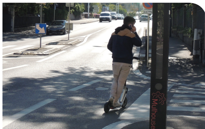
Tout en un : électromobilité, dernier kilomètre et smartphone...

Mulhouse Grand Centre a mis l'accent sur le piéton et l'accès aux services de proximité. La surface piétonne est restée constante. Les sites industriels en reconversion en cœur d'agglomération sont tous à proximité de pôles de transports en commun de masse. Un certain enclavement les laisse difficiles d'accès sans voiture.