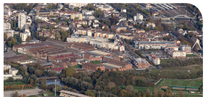
Le site Fonderie s'ouvre progressivement au reste de la ville

Dans l'enseignement supérieur, l' Université de Haute-Alsace (UHA) se développe assidûment. Elle accentue la spécificité de son offre de formation (filière STAPS en 2020) tout en s'ancrant dans le réseau transfrontalier du Rhin supérieur (EUCOR). Le campus Fonderie s'oriente clairement vers les métiers de l' industrie du futur en étoffant les bâtiments dédiés à ces formations. Le campus de Illberg finit de construire le « learning center » pour offrir une plateforme d'apprentissage et de recherche entre tous les acteurs de l'enseignement supérieur.