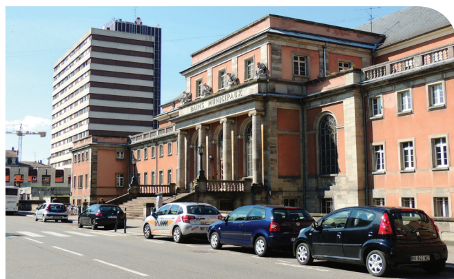
Quelle place pour le sport de proximité en centre urbain ? L'exemple des Bains municipaux.

8 établissements hospitaliers et médicaux