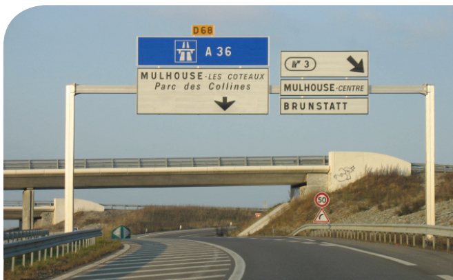
Les infrastructures routières, possibles ressources foncières et supports des mobilités alternatives

Dans le domaine des mobilités individuelles, les infrastructures routières sont un point fort. Les routes et voies rapides sont régulièrement modernisées et le territoire très bien maillé. Elles consomment toutefois énormément d'espace et induisent une ville étalée, carbonée voire privatisée. Les axes cyclables restent cantonnés aux usages de loisirs malgré les courtes distances et la topographie du territoire.