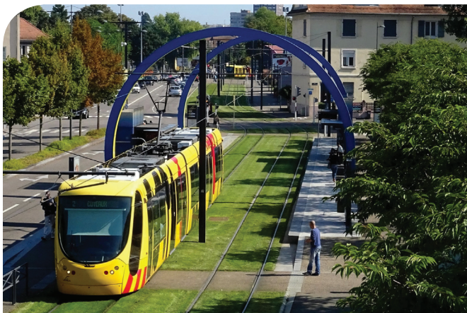
Réaménagement des espaces publics autour du réseau tram

Le territoire profite d'infrastructures variées pour une accessibilité performante aux échelles locales, régionales et internationales. L'offre de services aux usagers, l'intégration urbaine des réseaux existants ou l'articulation entre transports et urbanisation sont des leviers d'amélioration.