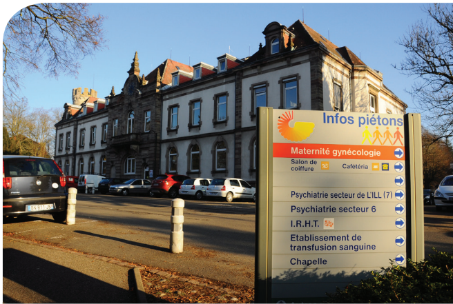
Quelles opportunités urbanistiques pour les services publics de l'Etat ? - L'exemple de l'hôpital du Hasenrain.

Les infrastructures des services publics de l'Etat sont présentes grâce au poids du bassin de population (santé, justice, police...). Leur maillage territorial a tendance à se détendre et s'implanter loin des transports en communs performants. Les collectivités manquent de prise sur ces choix contribuant à fragiliser la ville dense.