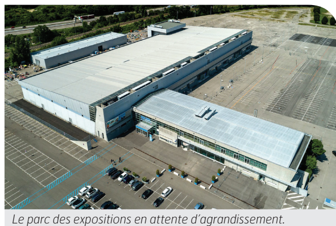
Le parc des expositions en attente d'agrandissement.

Dans le domaine économique et technologique, la ville montre de l'ambition dans le numérique. La réussite du salon de l'industrie du futur BE:EST attire les visiteurs et rend l' extension du parc des expositions encore plus viable. Les nombreux services , applications ou équipements inspirés des nouvelles technologies numériques participent au développement d'une agglomération plus « intelligente » .