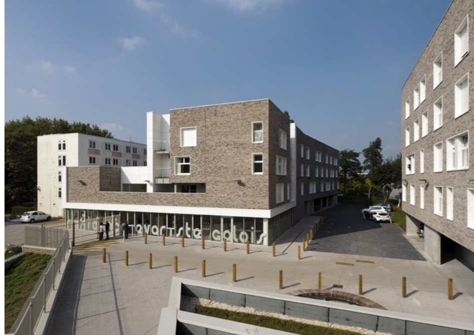
Résidence universitaire Evariste Galois - Villeneuve d'Ascq