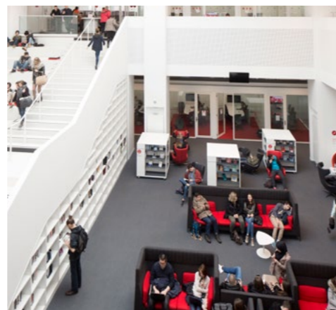
Bibliothèque universitaire Liliad

La lettre de l'Observatoire du logement des étudiants, document annuel qui revient sur la vie de l'observatoire, les actualités et stratégies des partenaires est disponible sur le site internet de l'Agence : https://www.adu-lille-metropole.org