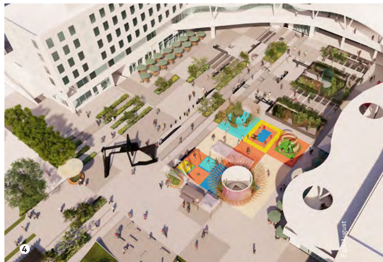
4. Place Terrasses (image de synthèse).

Le plan ci-contre présente la centralité d'Évry-Courcouronnes aujourd'hui ainsi que les principales interventions prévues à court terme (urbanisme transitoire) ou à moyen/long terme. Dans tous les cas, il s'agit de changer l'expérience vécue des habitants, salariés, étudiants, visiteurs, etc., et de contribuer ainsi à intensifier l'attractivité de la ville, et plus globalement de Grand Paris Sud.