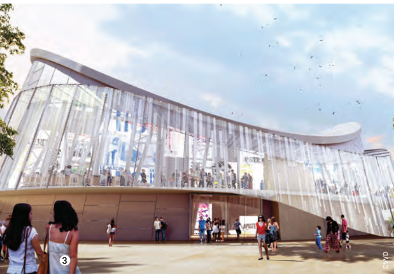
3. Arènes (image de synthèse).