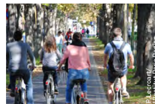
De nombreux cyclistes se promènent dans les rues de Paris lors de la Journée « Paris sans voiture », le 27 septembre 2015.