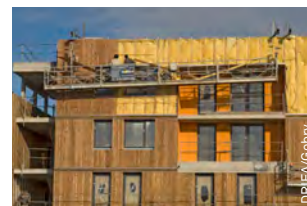
À Clichy-sous-Bois, l'isolation par l'extérieur de logements en construction.

Développer l'hydrogène renouvelable et bas-carbone est indispensable pour décarboner un certain nombre d'usages et de secteurs, en particulier dans l'industrie et les mobilités lourdes (transport aérien, maritime et fluvial, poids lourds longue distance, bennes à ordures ménagères...), ainsi que pour le stockage d'énergie de longue durée et de grande capacité. Si la production d'hydrogène bas-carbone