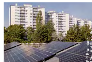
Les toits de l'école publique Paul-Langevin, à Fontenay-sous-Bois, sont équipés de panneaux photovoltaïques.