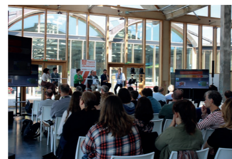
Bazaar St-So Lille

Les perspectives pour 2022 et les années à venir sont néanmoins très encourageantes : l'activité est repartie de manière dynamique au 1 er trimestre 2022 et les perspectives sont clémentes, avec déjà l'accueil de grands congrès gagnés, tel que le « Congress of the European Association for Clinical Pharmacology and Therapeutics » qui aura lieu en 2027.