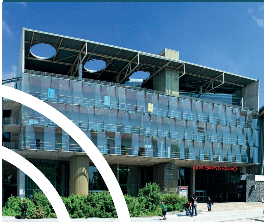
Lille Grand Palais