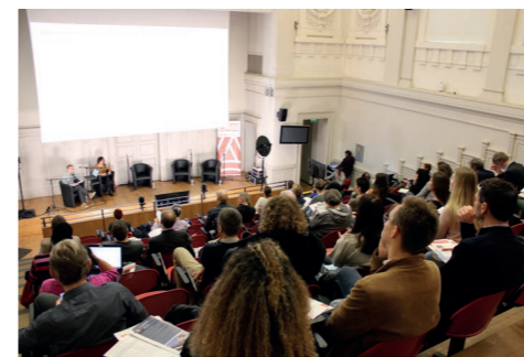
École Nationale Supérieure des Arts et Métiers Lille