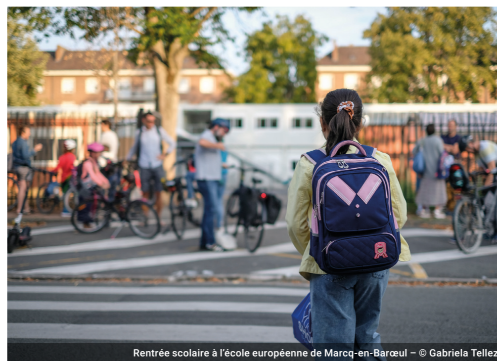
Rentrée scolaire à l'école européenne de Marcq-en-Barœul

Le caractère international de la métropole s'apprécie aussi à travers sa population : 90 000 personnes sont de nationalité étrangère (dont binationaux), soit 8 % des 1,2 million d'habitants 10 . Métropole étudiante reconnue pour la qualité de ses établissements d'enseignement supérieur, Lille accueillait 14 000 étudiants étrangers en 2020 11 . Ce sont autant de personnes qui créent et enrichissent les liens entre la métropole et le reste du monde, qu'il s'agisse de liens culturels, commerciaux, financiers, de solidarité, etc.