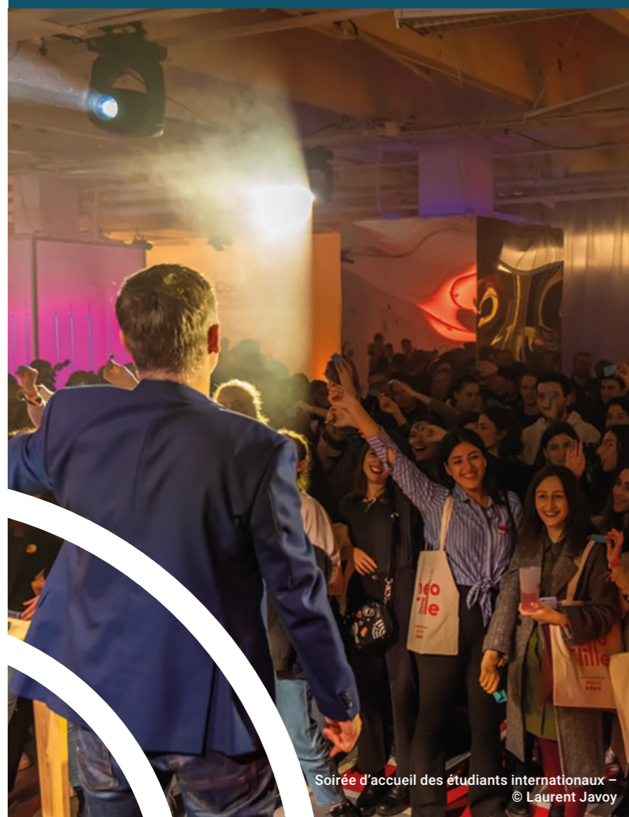
Soirée d'accueil des étudiants internationaux - © Laurent Javoy